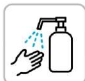
アルコール消毒にご協力ください Please make sure to conduct alcohol disinfection