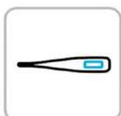
来館時に検温にご協力ください Please check body temperature upon arrival