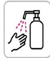
アルコール消毒液の配置 Installation of alcohol disinfectant