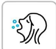
うがいのご協力をお願いします Please gargle whenever possible