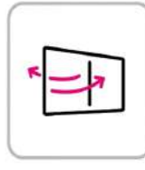
換気の徹底 Thorough ventilation