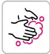
手洗いの徹底 Practice proper handwashing