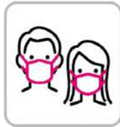
スタッフのマスク着用 Staffs are wearing face masks