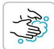
手洗いのご協力をお願いします Please wash hands whenever possible