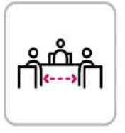
ソーシャルディスタンス確保(食事) Keep social distancing (during meals)