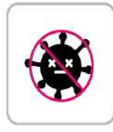
アルコール消毒済み(お部屋) Alcohol disinfection of guest rooms