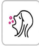
スタッフのうがい徹底 Gargle thoroughly whenever possible