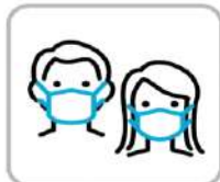
マスク着用にご協力ください Please make sure to wear face masks