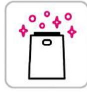
空気清浄機の設置 Installation of air purifier