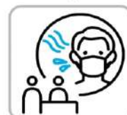
体調不良時はお申し出ください Please inform us when you feel unwell